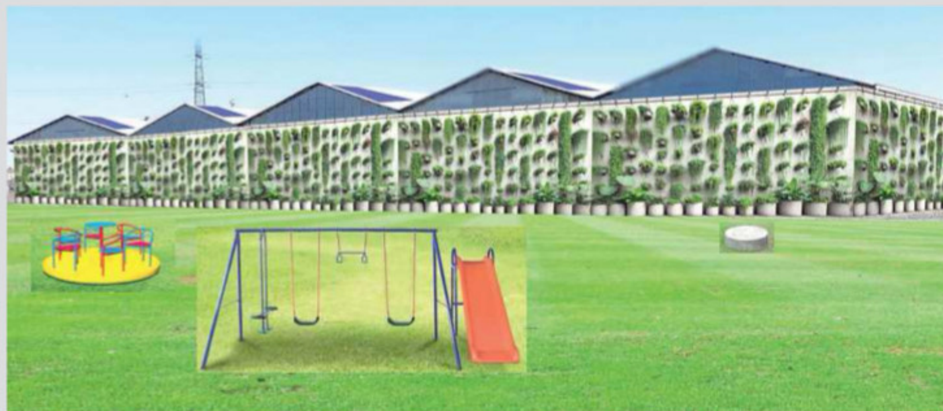
Uno dei progetti vincenti nel contest lanciato da If Festival: un bosco verticale al posto dei capannoni abbandonati a pag. 14