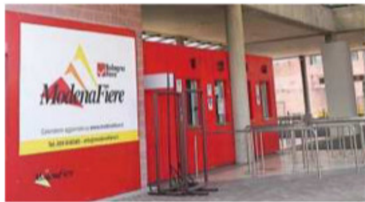
» Bianchi a pag. 12

Presentata l'86esima edizione della "Campionaria": «Formula rinnovata e ambiziosa»