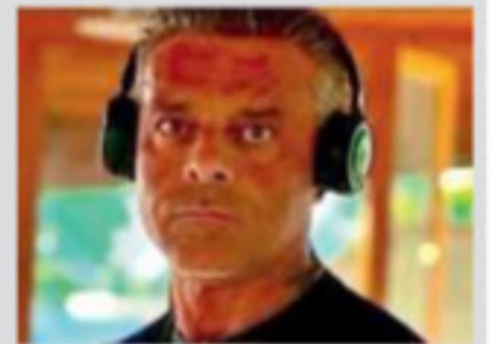
» La Mantia a pag. 5

Napoli Uccide il rivale invia la foto alla ex e poi si suicida