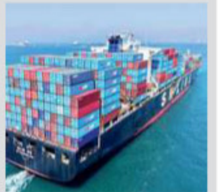
» Fantozzi a pag. 2

La guerra dei dazi L'Ue tra "vendetta" e proposta di azzeramento