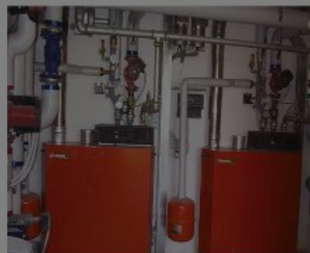
Caldaie a condensazione da Kw 160/120