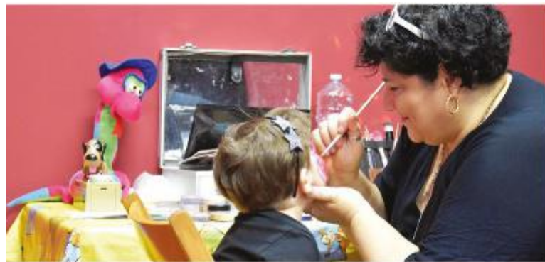
TRUCCA BIMBI - Un appuntamento molto amato dal pubblico più giovane

A lla Fiera di Modena è bello essere bimbi! Sono numerose le occasioni di divertimento che l'ottantesima edizione della "Campionaria" offre ancora fino al Primo maggio ai piccoli visitatori ed alle loro famiglie. È un programma decisamente accattivante quello che offre l'area "LibriInfiera". Ancora tanti gli appuntamenti in programma, tra cui spiccano i laboratori manuali per realizzare fiori di carta e segnalibri, decorare shopper e tovaglette e sull'uso dei semi volti a conoscere i segreti della natura. Anche il gioco avrà un ruolo di primo piano, con "PuùPaz-