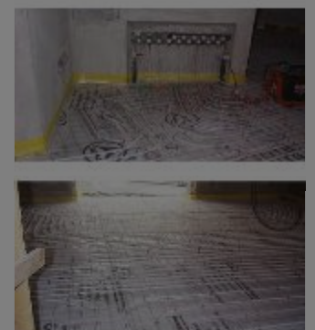
Pannelli a pavimento

MODENA - VIA UNGHERIA, 26 Tel. 059/450302 - Fax 059/451028