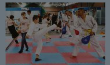
SPORT - Tanti in cui cimentarsi

Spazio automobiline. Intrattenimento divertimento, ma al tempo stesso educazione... stradale. In fiera è stata allestita una pista rivolta, su cui è possibile cimentarsi alla guida di Go Kart a pedali. I partecipanti, bambini e ragazzi dai 3 ai 14 anni verranno istruiti all'educazione stradale e all'utilizzo corretto dell'automobilina, in modo ludico/educativo e grazie all'omologazione dei mezzi biposto i più piccoli potranno provarli accompagnati dal genitore anche nella giornata di oggi venerdì 27 aprile. Pista quad. Dalle automobiline a pedali ai quad, il Motoclub Palagano e Piacentini Quad gestiranno una pista per quad e bici elettriche, allestita nell'area cortiliva della Fiera. Istruttori, mezzi e attrezzature