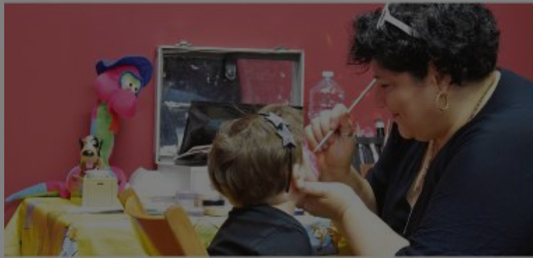
TRUCCA BIMBI - Un appuntamento molto amato dal pubblico più giovane

A lla Fiera di Modena è bello essere bimbi! Sono numerose le occasioni di divertimento che l'ottantesima edizione della "Campionaria" offre ancora fino al Primo maggio ai piccoli visitatori ed alle loro famiglie. È un programma decisamente accattivante quello che offre l'area "LibriIn-fiera". Ancora tanti gli appuntamenti in programma, tra cui spiccano i laboratori manuali per realizzare fiori di carta e segnalibri, decorare shopper e tovaglette e sull'uso dei semi volti a conoscere i segreti della natura. Anche il gioco avrà un ruolo di primo piano, con "PuùPaz-