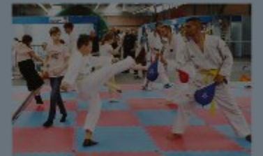
SPORT - Tanti in cui cimentarsi

Spazio automobiline. Intrattenimento divertimento, ma al tempo stesso educazione... stradale. In fiera è stata allestita una pista rivolta, su cui è possibile cimentarsi alla guida di Go Kart a pedali. I partecipanti, bambini e ragazzi dai 3 ai 14 anni verranno istruiti all'educazione stradale e all'utilizzo corretto dell'automobilina, in modo ludico/educativo e grazie all'omologazione dei mezzi biposto i più piccoli potranno provarli accompagnati dal genitore anche nella giornata di oggi venerdì 27 aprile. Pista quad. Dalle automobiline a pedali ai quad, il Motoclub Palagano e Piacentini Quad gestiranno una pista per quad e bici elettriche, allestita nell'area cortiliva della Fiera. Istruttori, mezzi e attrezzature