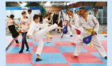
SPORT - Tanti in cui cimentarsi

Pista quad. Dalle automobiline a pedali ai quad, Il Motoclub Palaganò e Piacentini Quad gestiranno una pista per quad e bici elettriche, allestita nell'area cortiliva della Fiera. Istruttori, mezzi e attrezzature