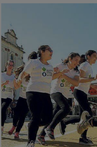
Una precedente edizione

Una manifestazione benefica che coinvolgerà Mirandola, Cavezzo, Nonantola, Lama Mocogno e Polinago.