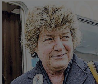
Susanna Camusso, Cgil

Oggi giornata tutta modenese per il segretario generale della Cgil Susanna Camusso che sarà presente all'assemblea generale della Cgil modenese che avvia il percorso del 18° Congresso del sindacato.