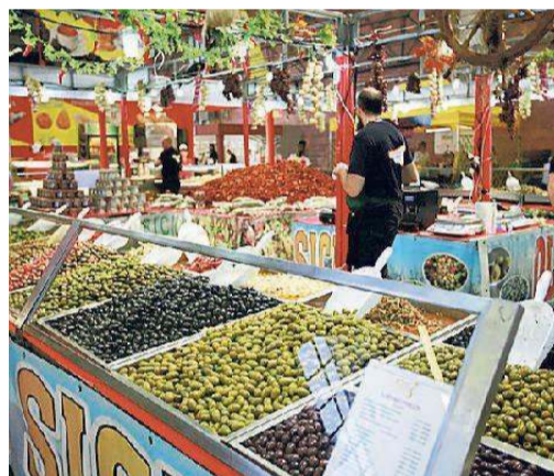
Olive per tutti i gusti nel reparto gastronomico

Aperti i padiglioni, tanti i modenesi a curiosare tra gli stand Un'edizione che fa divertire soprattutto bimbi e ragazzi