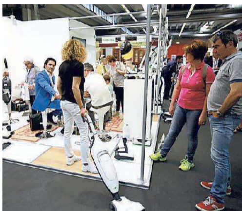
Dimostrazione per elettrodomestico