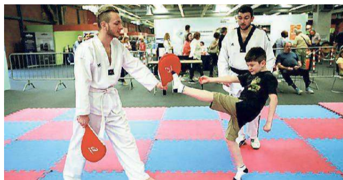
Un bimbo scopre le arti marziali

(per under 15), lanciandosi in un percorso a ostacoli. Gli amanti della natura hanno potuto apprezzare esibizioni con i cavalli de "Il Mulino di Pavullo" nell'area all'esterno del padiglione B. Uno spazio in cui saranno proposte esibizioni e curiosità fino al primo maggio. Nel percorso