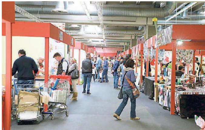
Visitatori tra gli stand della Fiera di Modena lo scorso anno

Sino al 1° maggio ingresso gratuito tra stand e iniziative che spaziano dal cibo allo sport, tra cavalli e arti marziali