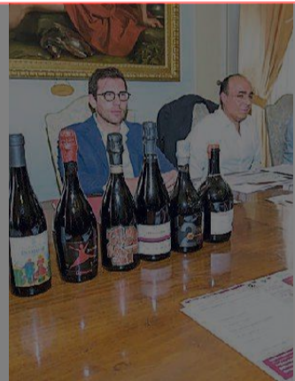
La presentazione dell'iniziativa

Per l'occasione non può mancare la musica. Alle 20 si terranno, in contemporanea, tre concerti: gli Skandals si esibiranno in piazza San Francesco; in largo San Giorgio ci sarà la musica degli Onirica e tra piazzetta San Biagio e via Emilia risuoneranno le note dei Garage Damedeo. La festa proseguirà, dalle 22 fino a tarda notte, al Bamboo, presso il parco Novi Sad. Per tutto il corso