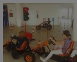
BAMBINI AL VOLANTE - L'educazione stradale si impara giocando

Intrattenimento divertimento, ma al tempo stesso educazione... stradale. In fiera è stata allestita una pista su cui è possibile cimentarsi alla guida di Go Kart a pedali. I partecipanti, bambini e ragazzi dai 3 ai 14 anni verranno istruiti all'educazione stradale e all'utilizzo corretto dell'automobilina, in modo ludico/educativo e grazie all'omologazione dei mezzi biposto i più piccoli potranno provarli accompagnati dal genitore, nelle giornate di mercoledì 25, giovedì 26 e venerdì 27 aprile.