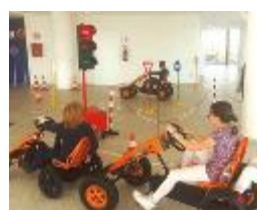
BAMBINI AL VOLANTE - L'educazione stradale si impara giocando

Intrattenimento divertimento, ma al tempo stesso educazione... stradale. In fiera è stata allestita una pista su cui è possibile cimentarsi alla guida di Go Kart a pedali. I partecipanti, bambini e ragazzi dai 3 ai 14 anni verranno istruiti all'educazione stradale e all'utilizzo corretto dell'automobilina, in modo ludico/educativo e grazie all'omologazione dei mezzi biposto i più piccoli potranno provarli accompagnati dal genitore, nelle giornate di mercoledì 25, giovedì 26 e venerdì 27 aprile.