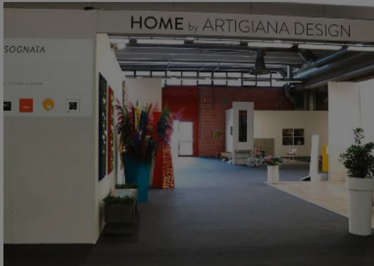
INFINITE POSSIBILITÀ - E tutte rigorosamente su misura

N ell'ambito della Fiera lo spazio "Home" a cura di Artigiana Design è tra le aree di maggior interesse. Il progetto modenese specializzato in arredamenti e complementi di design tutti realizzati su misura secondo le necessità dei clienti "Artigiana Design", infatti, è pronto ad accogliere i visitatori presso la sezione Casa Interni nel padiglione A, con una struttura espositiva di circa 430 mq intitolata 'Home', ovvero 'la realizzazione della casa dei tuoi sogni'. Ancora un'abitazione nel vero senso del termine, uno spazio abitativo dilatato dove far accedere i visitatori e far loro realizzare l'esperienza di entrare fisicamente, vedere,