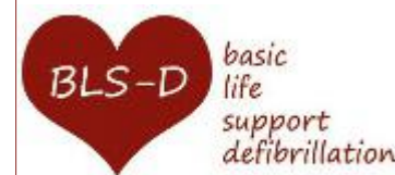
BLS-D - Un corso per l'utilizzo del defibrillatore

Ogni giorno varie possibilità a cui partecipare