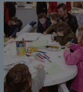
ATTIVITÀ PER BAMBINI - Giochi, palloncini e truccabimbi

Ore 10.00 – 22.00: Manovre di BLS e disostruzione - Attività di promozione della salute e dei corretti stili di vita Ore 10.00–12.00: Calcolo dell'indice di rischio cardiovascolare e neurologico (misurazione di colesterolo, glicemia, indice di massa corporea, pressione arteriosa, consulenza medica) Ore 15.00–20.00: Corso BLS-D (max. 12 iscritti) Ore 15.00–20.00: Attività per bambini (giochi, palloncini, cartoni animati, truccabimbi)