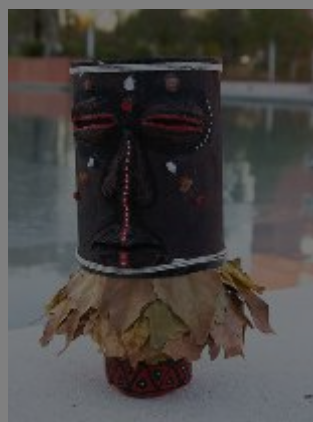
RicicAVIS - Un laboratorio di riciclaggio creativo

Dato il "posto d'onore" della pallavolo all'interno della Fiera, la presenza della FIPAV, Federazione Italiana Pallavolo, merita un piccolo focus. Il Comitato Territoriale di Modena sarà presente con gli stand 605-607-608-609 all'interno del padiglione B. Non solo dimostrazioni sportive, ma anche laboratori e attività per bambini, in collaborazione con AVIS e ERREA. Avis è "sponsor della solidarietà" di FIPAV con cui ha firmato un accordo che prevede la presenza dell'associazione agli appuntamenti della Pallavolo con attività congiunte molto spesso rivolte ai più piccoli e alle famiglie.