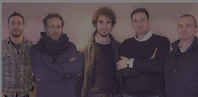
Foto di gruppo per il team Evensi