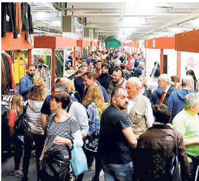
Avventori all'interno della Fiera campionaria

Altro importante evento le premiazioni del 12° "Palio della Ghirlandina", ovvero la gara di qualità tra aceti balsamici tradizionali di Modena della tradizione familiare.