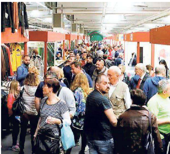
Avventori all'interno della Fiera campionaria

Altro importante evento le premiazioni del 12° "Palio della Ghirlandina", ovvero la gara di qualità tra aceti balsamici tradizionali di Modena della tradizione familiare.