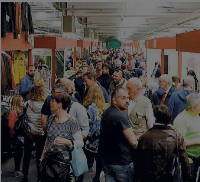
Avventori all'interno della Fiera campionaria

Altro importante evento le premiazioni del 12° "Palio della Ghirlandina", ovvero la gara di qualità tra aceti balsamici tradizionali di Modena della tradizione familiare.