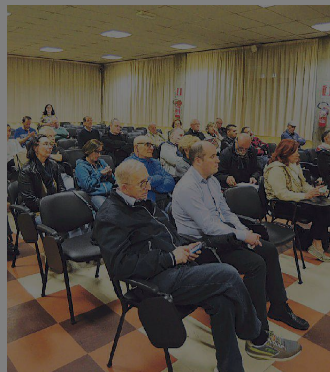
La platea dell'incontro di ieri sera nella sala di via Curie

zione ha scricchiolato quando è emerso che nei seggi ci saranno i rappresentanti di lista: «Rappresentanti di lista all'interno di uno stesso partito?», ha tuonato qualcuno, quasi a voler dire che serviranno chissà quali controlli per essere sicuri dell'esito del voto. Una mancanza di fiducia generaliz-