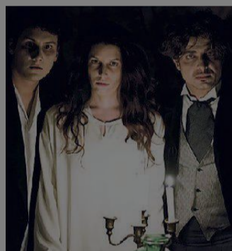
Alcuni protagonisti dello spettacolo

grandi e piccoli per riscoprire cose fantastiche che vivono ancora in una parte del territorio, grazie anche all'impegno di tante persone. Si spera solo nel bel tempo. (nic.cal.)