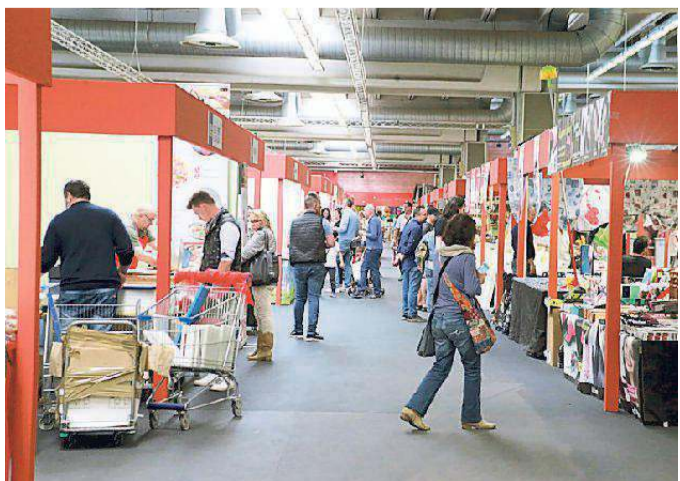
Padiglioni della Fiera di Modena

Un via vai di persone ha caratterizzato ieri il 25 Aprile a ModenaFiere la quarta giornata della 79esima Fiera di Modena, la manifestazione di primavera più amata dai modenesi che chiude così il primo dei due lunghi weekend d'apertura.