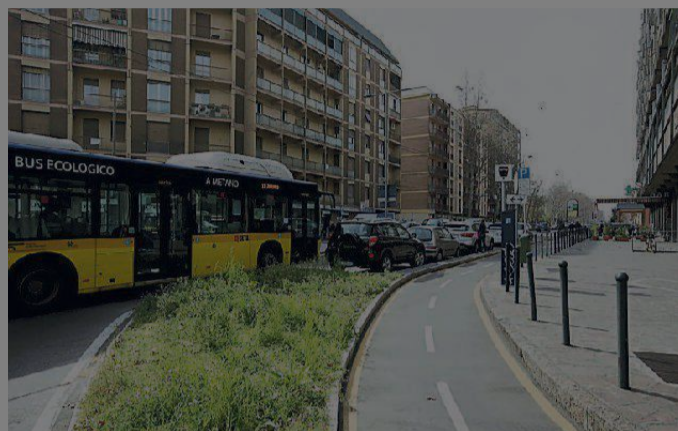
Autobus di Seta in via Giardini: per gli autisti tanti disagi

L'Agenzia Mobilità: «Ci sono problemi». Frequenze riviste. Mezzi pubblici in coda nel traffico assieme alle auto