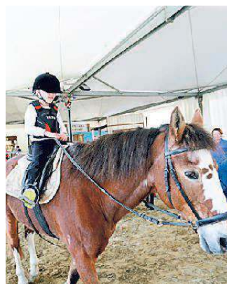
L'emozione di cavalcare per i bimbi