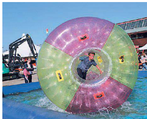
La ruota sull'acqua: divertimento assicurato

praticare anche da adulti: io, per esempio, ho iniziato all'età di 50 anni». È possibile provare in questi giorni? «No, sia per motivi di sicurezza - dichiara l'intervistato - sia per il poco spazio a disposizione, ma non è escluso che potremo dare questa possibilità il prossimo