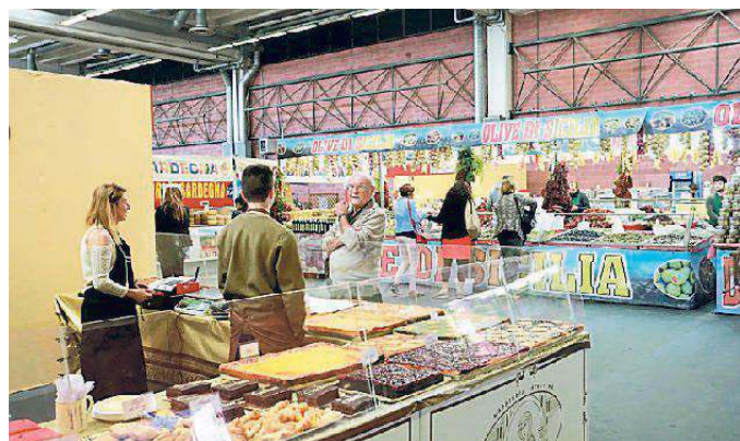
L'angolo dei banchi con i prodotti enogastronomici italiani

Aperti i battenti della campionaria che anche quest'anno punta sul mix vincente tra enogastronomia e divertimento