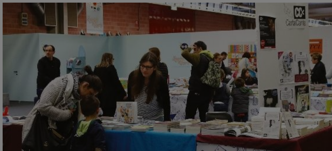
DALLE 15 - A partire da questo pomeriggio iniziano sette giorni di grande festa per Modena e i modenesi

Quattro le sezioni espositive tradizionali: Casa Interni con lo spazio Artigiana Design, Casa Esterni, Enogastronomia e Mercato. 33.000 i metri quadrati che trecento espositori, provenienti da tredici diverse Regioni italiane, andranno ad animare e colorare.