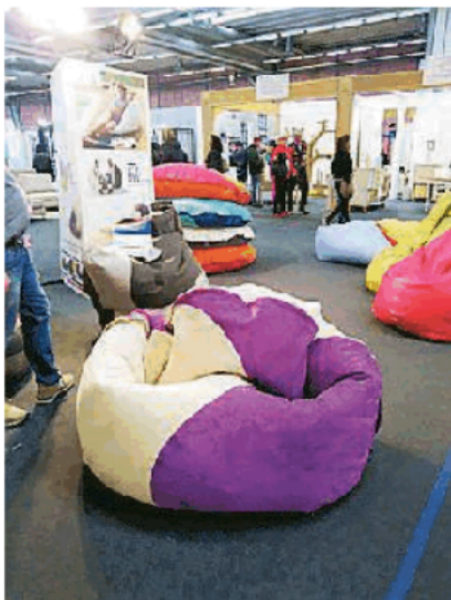
La poltrona "Nuvola"