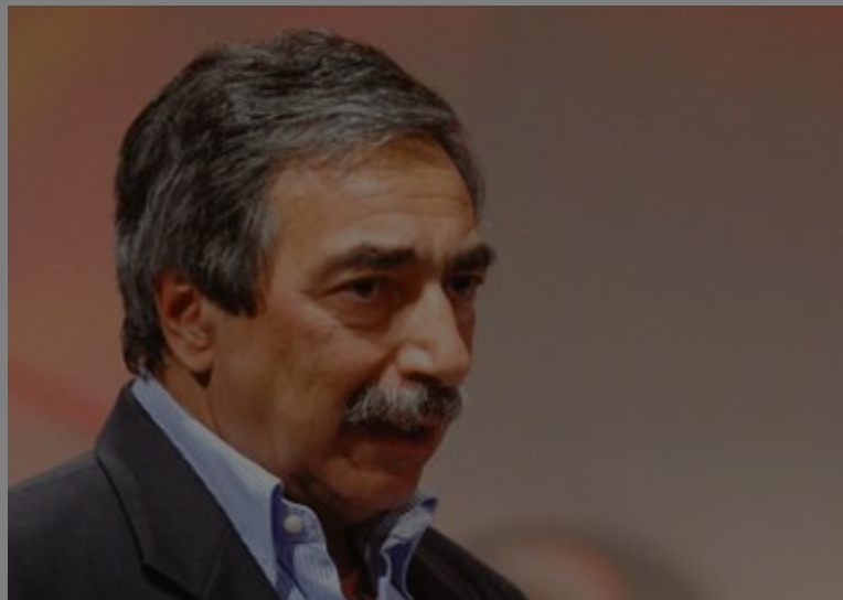
SPORTIVO - Dalla mente di Bartoletti sono nati Pressing e Calcio 2000

P er la missione speciale della Biblioteca del Gufo, ossia acquistare un ecografo per la pediatria del policlinico di Modena, alla Fiera arriva un inviato altrettanto speciale, ovvero Marino Bartoletti. Il noto giornalista mercoledì 25 aprile trasferisce il suo "Bar Toletti" al quartiere fieristico per l'evento sostenuto da Nevent Comunicazione e volto a contribuire alla raccolta fondi. L'appuntamento al "Bar Toletti" è per le 17:30, un'occasione unica per incontrare uno dei volti più amati nel panorama giornalistico sportivo (e non solo). Profondo e ironico, colto e sferzante, appassionato e sincero, Marino Bartoletti è uno di quei giornalisti che non