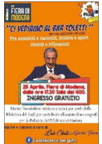
"BAR TOLETTI" - La locandina dell'appuntamento

Ha ideato e condotto "Quelli che il calcio..." e diretto il Guerin Sportivo