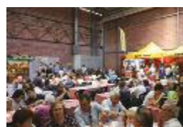
RISTORANTE - La convivialità al momento del pasto

Per coloro che vorranno passare una intera giornata alla Fiera di Modena tra spettacoli ed eventi sportivi, laboratori e showcooking, come sempre una vasta offerta per pranzo e cena sarà disponibile per soddisfare qualsiasi gusto, voglia e palato. Dal ristorante Tex Mex La Torre Antigua, alla pizza, passando per tigelle, burlenghi, spianata bolognese, pasta all'amatriciana, tortelli tipici reggiani, risotto e polenta. C'è l'imbarazzo della scelta, dunque.