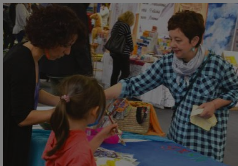
CREATIVITÀ - Laboratori che coinvolgono anche i più piccoli

A ll'interno del padiglione A troverà spazio una delle sezioni più frequentate della Fiera di Modena. Si tratta dell'Area Cultura, che ospiterà LibriInFiera, evento realizzato in collaborazione con SIGEM Edizioni e che, oltre a proposte editoriali ed incontri con gli autori, organizzerà diverse e coinvolgenti iniziative anche per i più piccoli. Nella medesima area sarà allestita Fierarte, mostra collettiva di artisti locali e nazionali a cura del Circolo degli Artisti di Modena, che quest'anno propone anche un'esposizione di alcuni abiti di scena pensati dalle sorelle modenesi Costume Designers Francesca e Roberta Vecchi per l'ultimo film diretto da Luciano Ligabue "Made in Italy". Nell'Area Creatività posizionata nello spazio tra il padiglione A e il padiglione C, l'Associazione Creatisti ai visitatori proporrà oggetti curiosi, sempre originali. Per gli amanti della cucina, da non perdere gli appuntamenti con gli showcooking realizzati in collaborazione col Consorzio Modena a Tavola, i laboratori e le degustazioni di prodotti tipici.