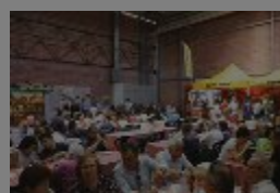
RISTORANTE - La convivialità al momento del pasto

Per coloro che vorranno passare una intera giornata alla Fiera di Modena tra spettacoli ed eventi sportivi, laboratori e showcooking, come sempre una vasta offerta per pranzo e cena sarà disponibile per soddisfare qualsiasi gusto, voglia e palato. Dal ristorante Tex Mex La Torre Antigua, alla pizza, passando per tigelle, burlenghi, spianata bolognese, pasta all'amatriciana, tortelli tipici reggiani, risotto e polenta. C'è l'imbarazzo della scelta, dunque.