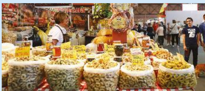
PRELIBATEZZE - Prodotti tipici

in Sala dei 400, premiazioni della 15esima edizione del premio "Fedeltà e Solidarietà" istituito dall'Unione Società Centenarie Modenesi. Del resto, uno dei principi fondamentali della fiera è naturalmente quello di evidenziare il proprio legame con il territorio.