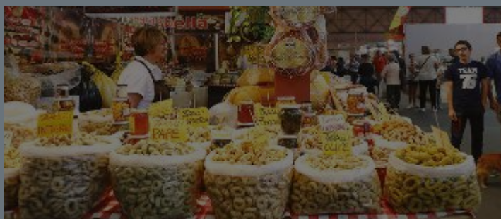
PRELIBATEZZE - Prodotti tipici

in Sala dei 400, premiazioni della 15esima edizione del premio "Fedeltà e Solidarietà" istituito dall'Unione Società Centenarie Modenesi. Del resto, uno dei principi fondamentali della fiera è naturalmente quello di evidenziare il proprio legame con il territorio.