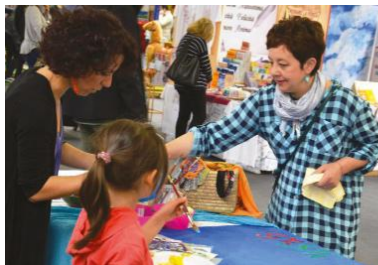
CREATIVITÀ - Laboratori che coinvolgono anche i più piccoli

A ll'interno del padiglione A troverà spazio una delle sezioni più frequentate della Fiera di Modena. Si tratta dell'Area Cultura, che ospiterà LibriInFiera, evento realizzato in collaborazione con SIGEM Edizioni e che, oltre a proposte editoriali ed incontri con gli autori, organizzerà diverse e coinvolgenti iniziative anche per i più piccoli. Nella medesima area sarà allestita Fierarte, mostra collettiva di artisti locali e nazionali a cura del Circolo degli Artisti di Modena, che quest'anno propone anche un'esposizione di alcuni abiti di scena pensati dalle sorelle modenesi Costume Designers Francesca e Roberta Vecchi per l'ultimo film diretto da Luciano Ligabue "Made in Italy". Nell'Area Creatività posizionata nello spazio tra il padiglione A e il padiglione C, l'Associazione Creartisti ai visitatori proporrà oggetti curiosi, sempre originali. Per gli amanti della cucina, da non perdere gli appuntamenti con gli showcooking realizzati in collaborazione col Consorzio Modena a Tavola, i laboratori e le degustazioni di prodotti tipici.